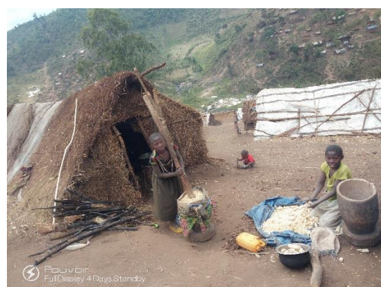
Situation des déplacés sur le site d'hébergement