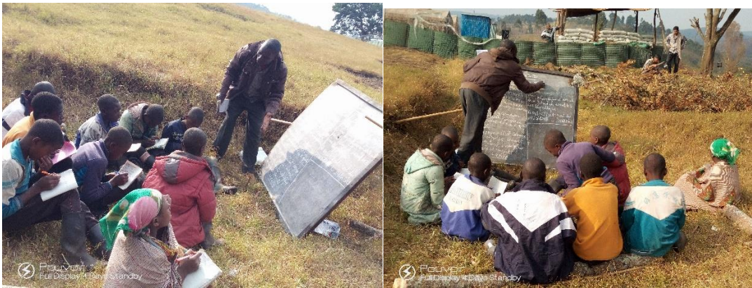
Encadrement des élèves de 6 -ème P en plein air sur le terrain de la MONUSCO