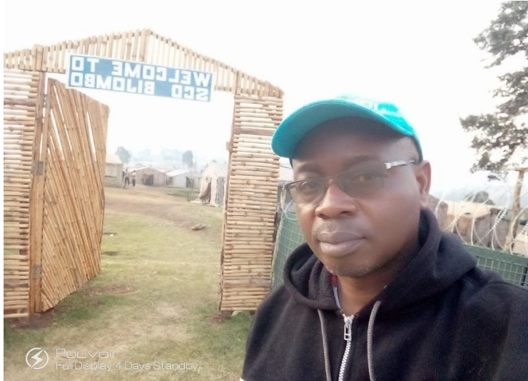
Le camp MONUCO offrant protection aux déplacés de Bijombo