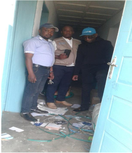
Visite du CS de Mikenge Pille