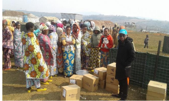
Pose avec les enfants dans le site Point Zero et discussion avec les femmes sur leur besoin dans le site des deplaces de Mikenge