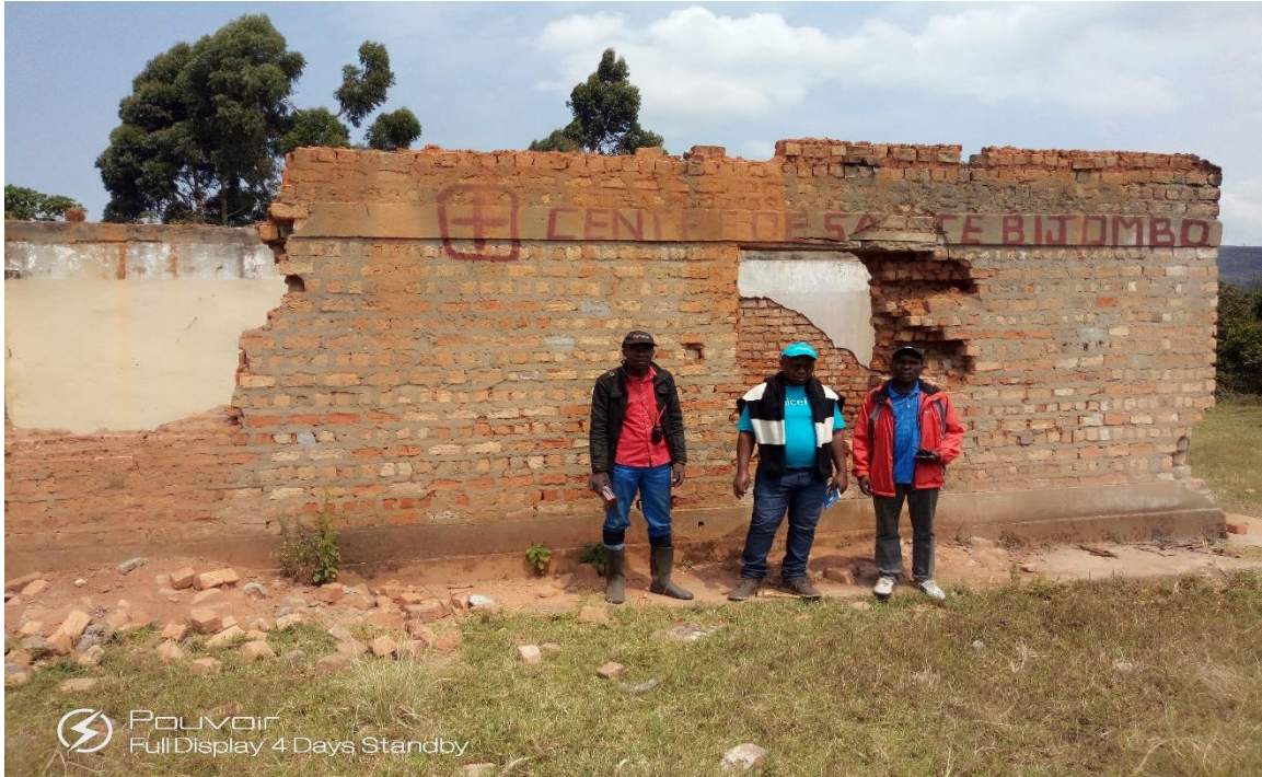
Le Centre de sante de Bijombo, brulé et pille en Octobre 2018