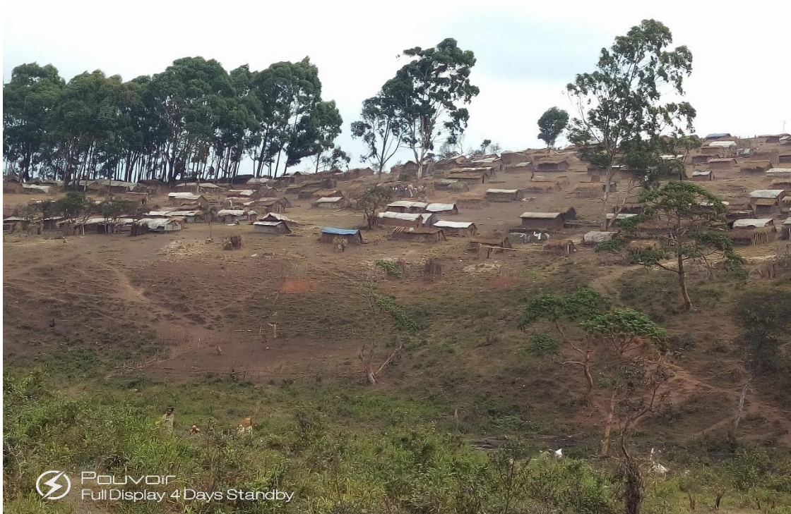
Vue d'une parti du site de deplaces de Bijombo