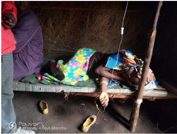
Malade en observation