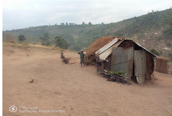
Situation des deplacees sur le site de d'hebergement