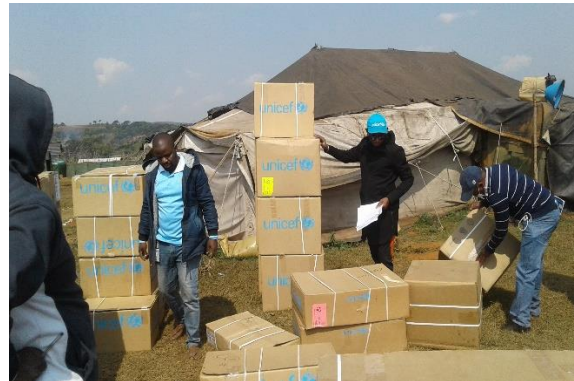
Visite des malades à l'HGR Itombwe et déploiement des médicaments pour le CS de Mikenge et Kipupu