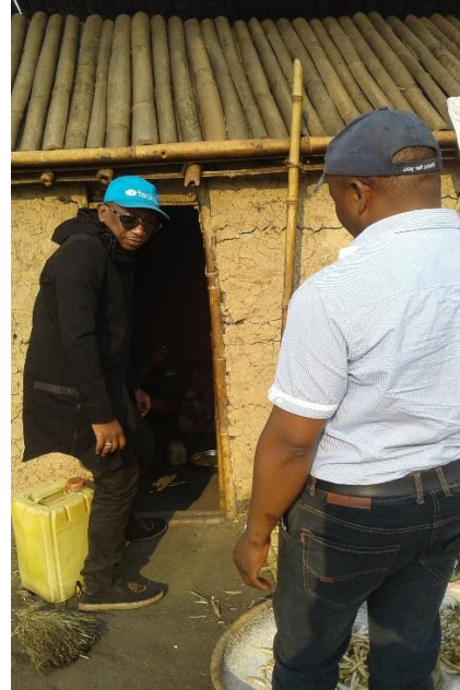
Visite des menages de fortune au niveau du site point Zero