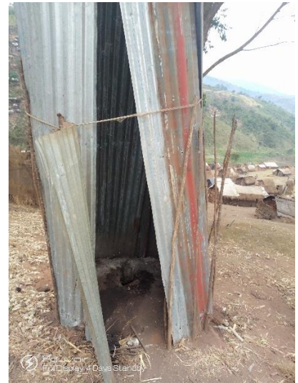
Situation d'accès a l'eau et assainissement sur le site