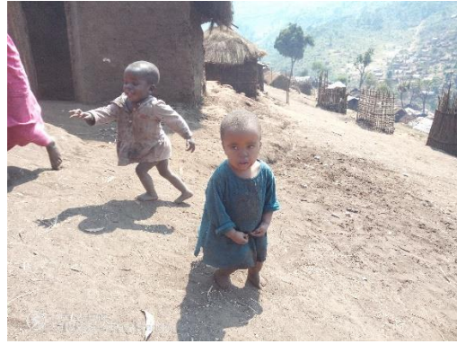
Certains enfants presentent les signes de malnutrition