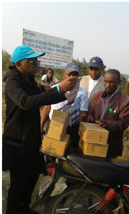
Sensibilisation de la population deplacee du point Zero sur l'utilisation du PUR, Depart pour Point Zero